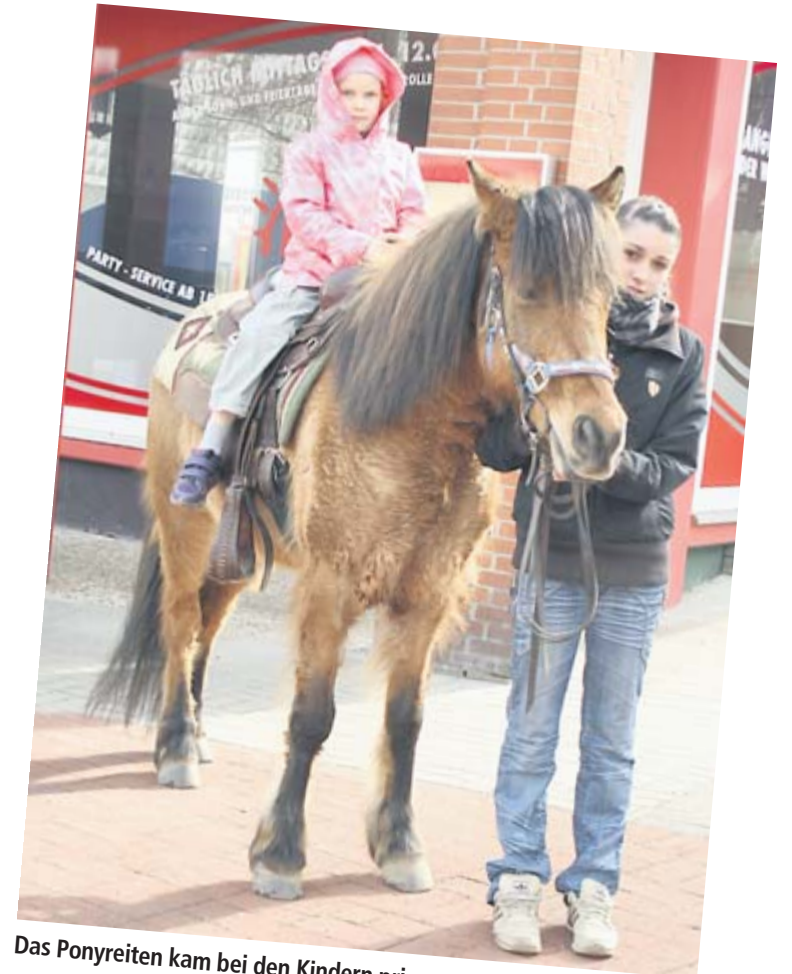
Das Ponyreiten kam bei den Kindern prima an.