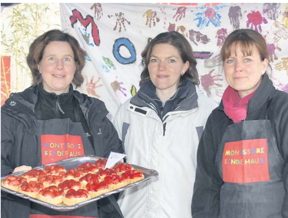
Am Montessori-Kuchenstand wurden leckere Törtchen serviert.