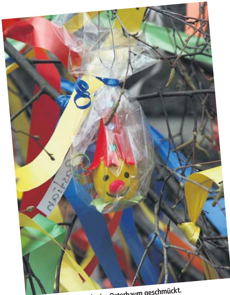
Mit viel Fantasie wurde der Osterbaum geschmückt.