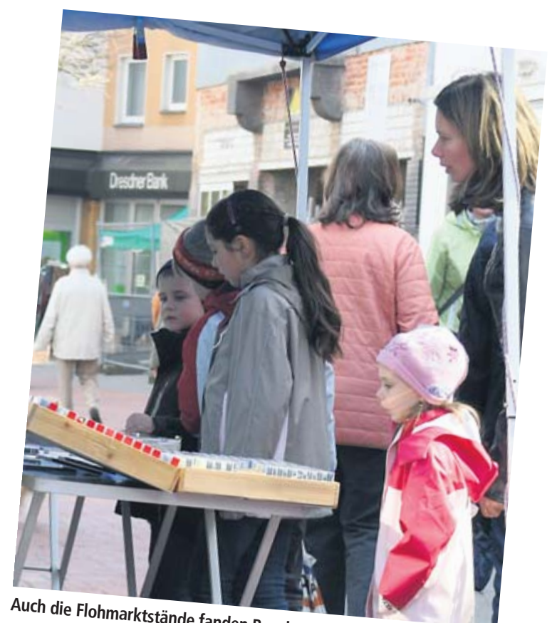
Auch die Flohmarktstände fanden Beachtung.