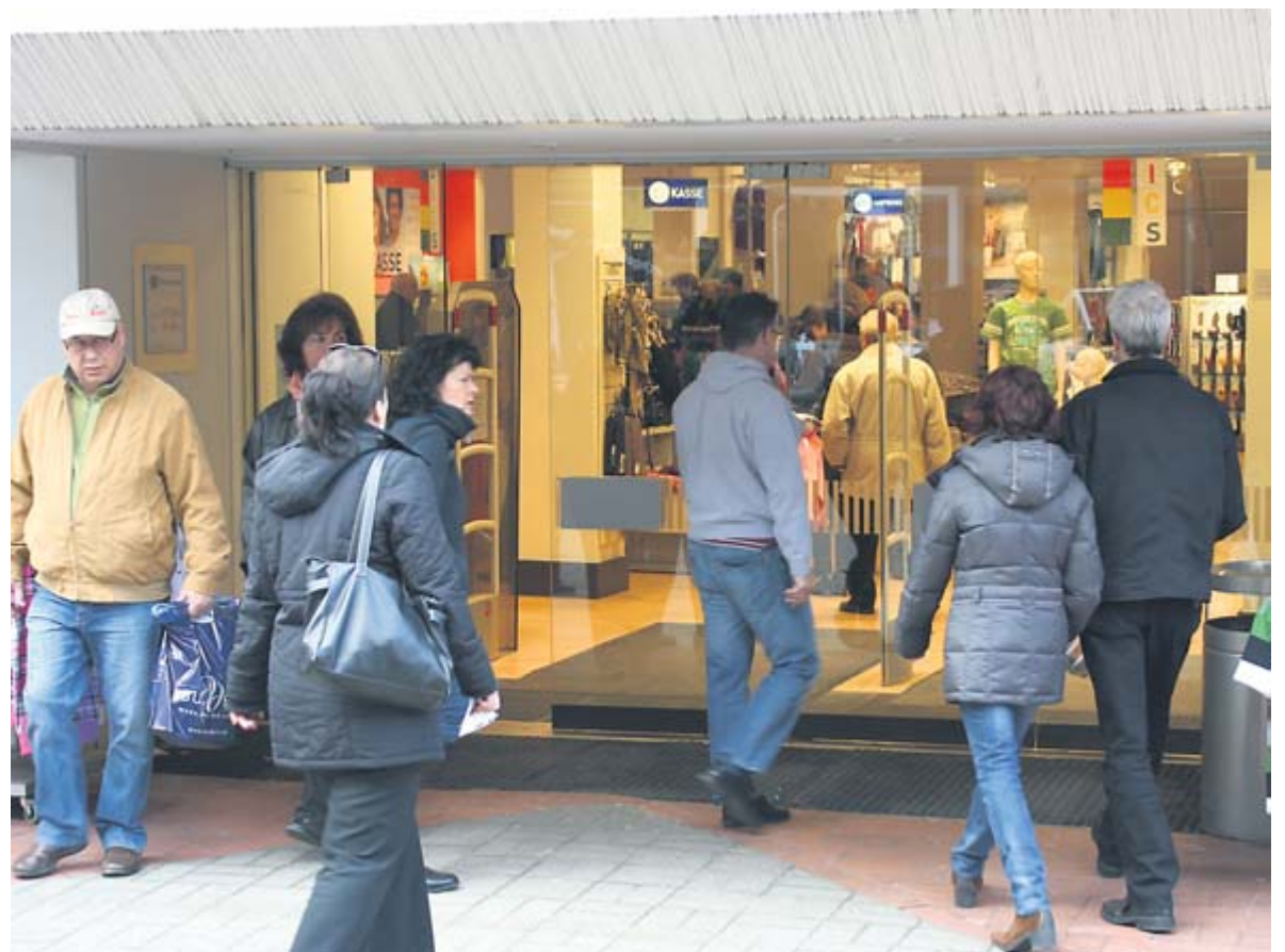
Nicht nur in der Marktstraße, sondern auch in den Geschäften war gestern Nachmittag einiges los.