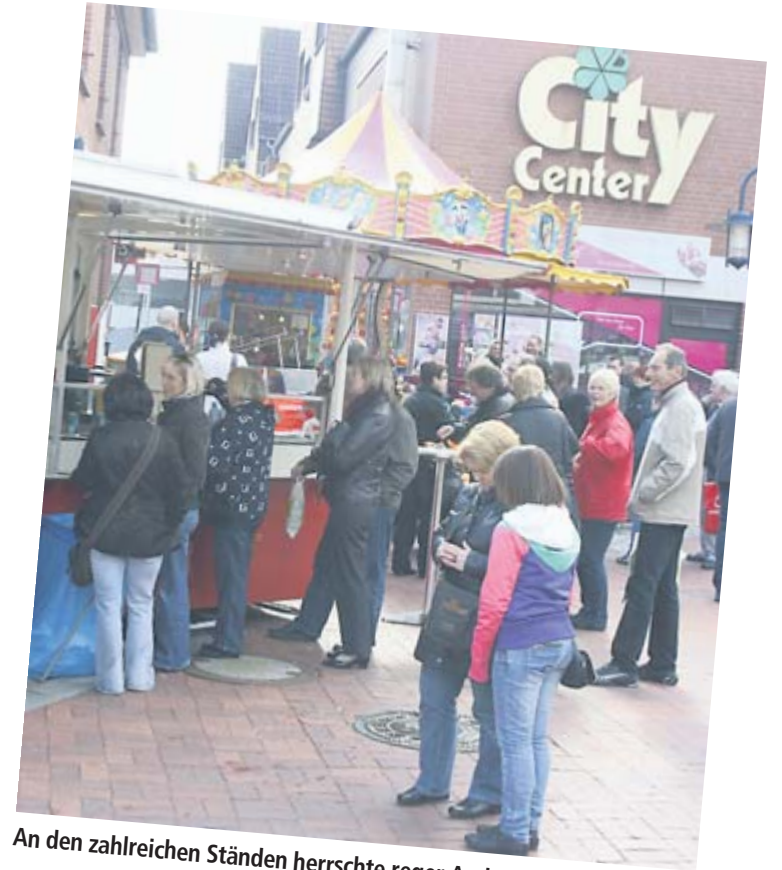
An den zahlreichen Ständen herrschte reger Andrang.