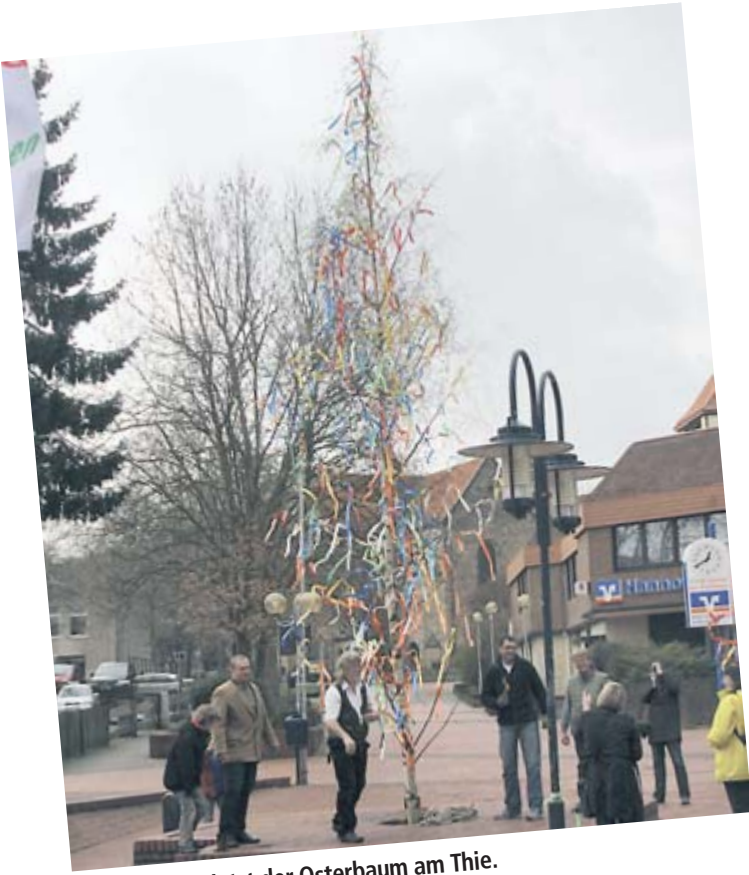
Bis Mai grüßt jetzt der Osterbaum am Thie.