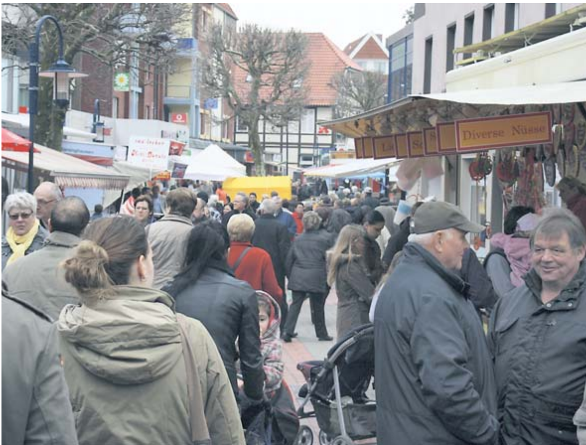
Im Laufe des Nachmittags füllte sich die City zusehends.