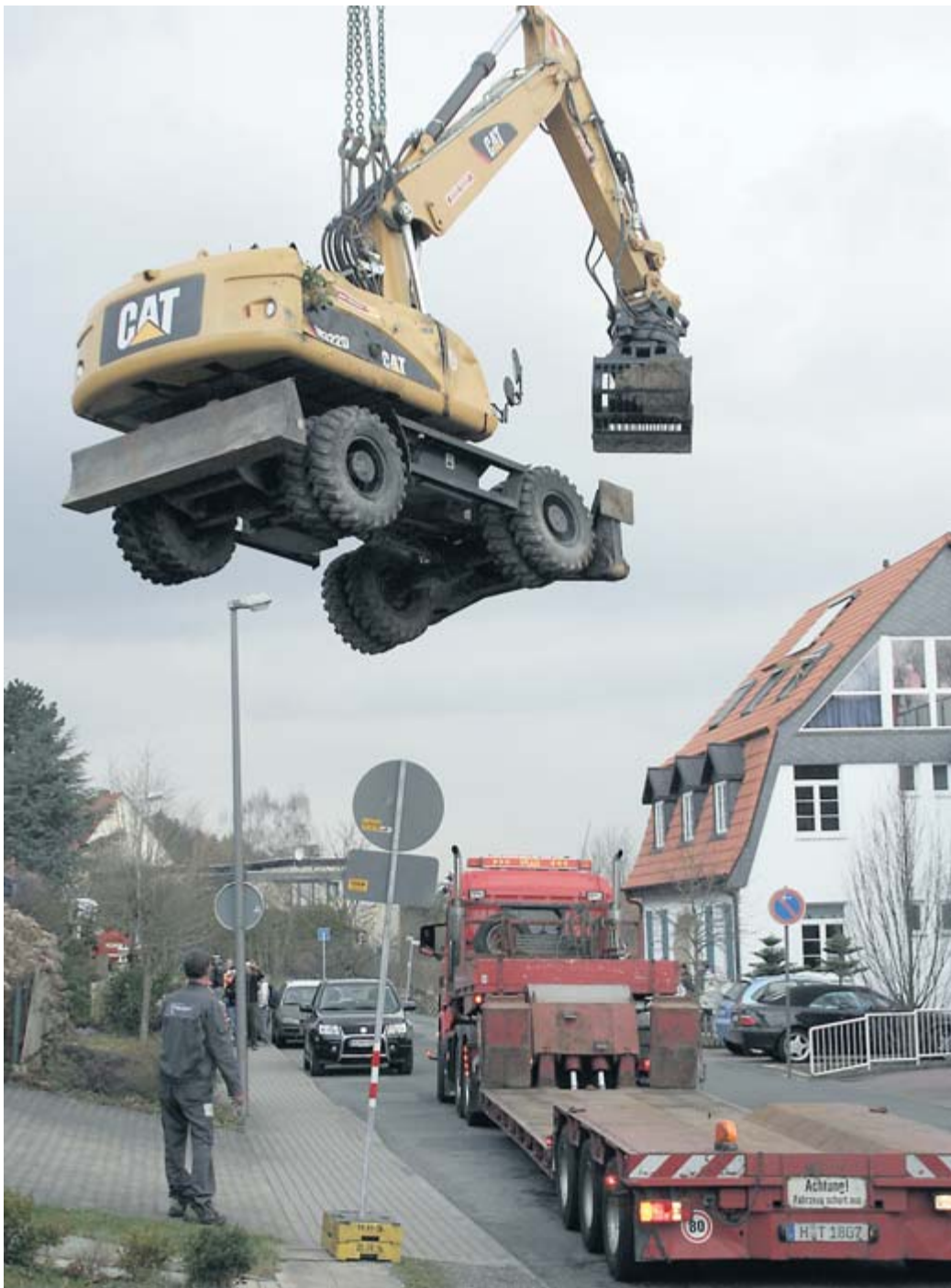
Fast geschafft: Langsam schwebt der Bagger über der Bullerbachstraße ein, wo der Tieflader schon wartet.